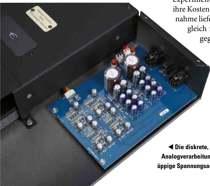
◀ Die diskrete, dennoch aber äußerst kompakte Analogverarbeitung besitzt eine eigene, erstaunlich üppige Spannungsaufbereitung.